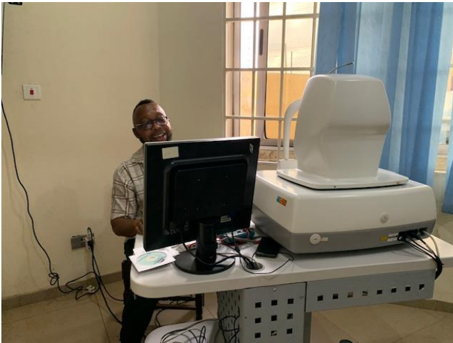
Een lachende oogarts in Ghana, blij met zijn apparatuur van Medic

nodig zijn, waaronder een Medic OK tafel, waarvoor al een bestelling is geplaatst. Met de mededeling, dat men op de wachtlijst staat. Dat wordt nog spannend: wie is het eerste klaar? De Ok of de Medic OK tafel? We mikken op begin 2024 ! kazi inaendelea (swahili voor: work in progress)