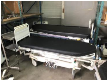
Een zending gedoneerde brancards worden bij Medic uitgeladen

Teneinde de continuïteit van het aanbod zoveel mogelijk te waarborgen, worden convenanten met ziekenhuizen en instellingen in de zorg afgesloten waarbij Stichting Medic als partner wordt aangewezen voor de te doneren apparatuur en goederen.