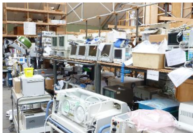
Een deel van de opslag van gerepareerde en geteste apparatuur

Het deel van de geschonken apparatuur dat niet meer te repareren valt, wordt gesloopt en materialen zoals koper, roestvrij staal en edelmetalen worden verzameld en verkocht. De opbrengst hiervan komt ten goede aan onze projecten.