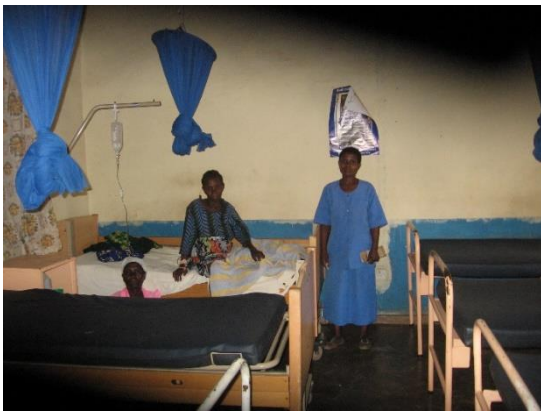
Kraamafdeling, districtziekenhuis Malawi