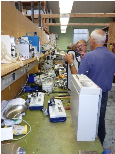
Testen en repareren van de apparatuur

Het gaat dan niet alleen om de levering van apparatuur, maar ook om de zorg hoe die apparatuur het beste tot zijn recht komt in de