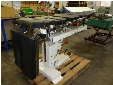
Mechanische voet voor ok tafel uit eigen productie

Ook heeft Medic een aantal eigen producten ontwikkeld die speciaal geëigend zijn voor gebruik in ontwikkelingslanden, zoals een mechanische ok tafel, een mobiele ok lamp die bij uitval van de elektriciteit op batterijen werkt, een fixateur externe en een verlosbed.