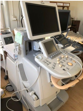
Gedoneerde echoapparatuur, getest en klaar voor verzending

Teneinde de continuïteit van het aanbod zoveel mogelijk te waarborgen, worden convenanten met ziekenhuizen en instellingen afgesloten waarbij Stichting Medic als partner wordt aangewezen voor de te doneren apparatuur en goederen.