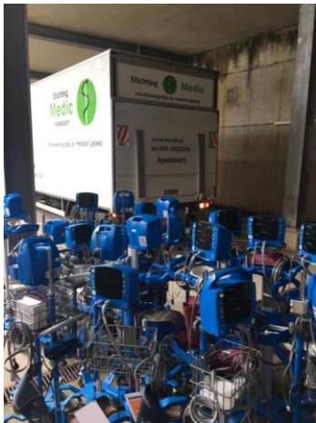
Een zending gedoneerde bloeddrukmeters is net bij Medic uitgeladen

Teneinde de continuïteit van het aanbod zoveel mogelijk te waarborgen, worden convenanten met ziekenhuizen en instellingen afgesloten waarbij Stichting Medic als partner wordt aangewezen voor de te doneren apparatuur en goederen.