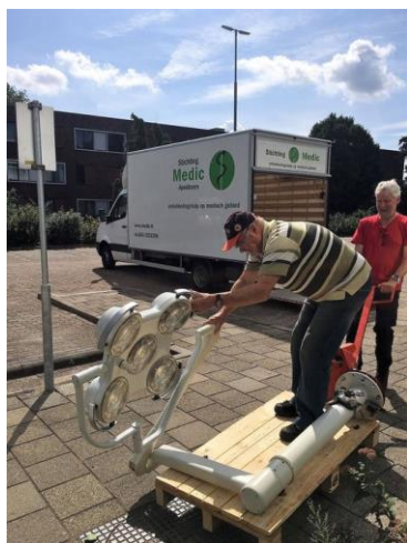
Een OK lamp wordt ingeladen bij het Albert Schweizer ziekenhuis

Teneinde de continuïteit van het aanbod zoveel mogelijk te waarborgen, worden convenanten met ziekenhuizen en instellingen afgesloten waarbij Stichting Medic als partner wordt aangewezen voor de te doneren apparatuur en goederen. In 2019 is o.a. een convenant getekend met het LUMC en het Albert Schweizer ziekenhuis. Een eigen vrachtwagen van Medic rijdt wekelijks door Nederland om de aangeboden goederen op te halen. In een wekelijkse vergadering van de projectleiders wordt ook het aanbod behandeld en bepaald wat wel of niet zinvol is om aan te nemen. De steeds mooiere, maar ook vaak meer ingewikkelde apparatuur, is niet altijd